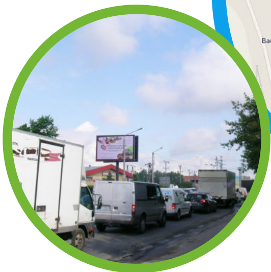
Zabki, ulice Piłsudskiego/Chełmżyńska.

Ogromnym atutem lokalizacji telebimów jest sąsiedztwo jednego z największych rynków hurtowych w Polsce- Praskiej Giełdy Spożywczej. Jej bliskość gwarantuje olbrzymi ruch samochodów i pieszych. Szacuje się, że Praską Giełdę Spożywczą codziennie odwiedza blisko 2,5 tys. kupców.